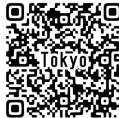
指導者講習会申込みQR